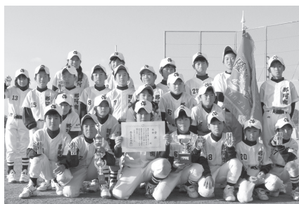
第1回大会 (2006. 12. 10) 優 勝 那珂南クラブ (博多区) 準優勝 吉塚クリッパーズ (博多区) 3 位 南片江レオーズ (城南区) 3 位 百道ストロングス (早良区)