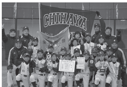
第7回大会 (2012. 12. 09) 優 勝 千早西クラブ (東 区) 準優勝 七隈ジュニアソフト (城南区) 3 位 原田ビッグボーイズ (東 区) 3 位 八田リトルベガサス (東 区)