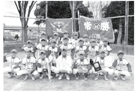
第12回大会 (2017. 12. 18) 優勝 清道クラブジュニア (博多区) 準優勝 千早西クラブ (東 区) 3 位 タートルズ板付クラブ (東 区) 3 位 百道ストロングス (早良区)