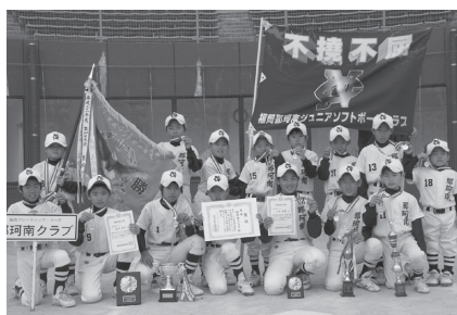
第5回大会 (2010. 12. 12) 優 勝 那珂南クラブ (博多区) 準優勝 美野島クラブ (博多区) 3 位 南片江レオーズイズ (城南区) 3 位 老司アーチンズ (南 区)