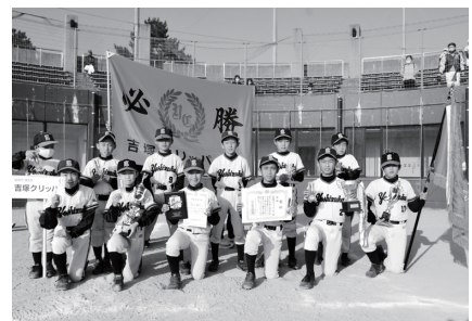
第15回大会 (2020. 12. 13) 優勝 吉塚クリッパーズ (西 区) 準優勝 八田リトルベガサス (東 区) 3 位 原田ビッグボーイズ (東 区) 3 位 鶴田少年ソフトクラブ (南 区)