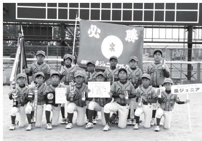
第17回大会 (2022. 12. 11) 優勝 泉ジュニア (西 区) 準優勝 山口塾 (城南区) 3 位 那珂南クラブ (博多区) 3 位 原田ビッグボーイズ (東 区)