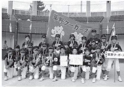
第11回大会 (2016. 12. 11) 優勝 草野クーガース (久留米) 準優勝 三宅イーグルス (南 区) 3 位 秋津小橋ソフトボールクラブ (熊本市) 3 位 赤坂ニューファイターズ (中央区)