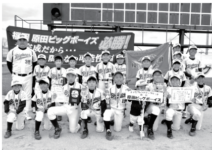
第13回大会 (2018. 12. 09) 優勝 原田ビッグボーイズ (西 区) 準優勝 千早西クラブ (東 区) 3 位 山口塾 (城南区) 3 位 百道ストロングス (早良区)