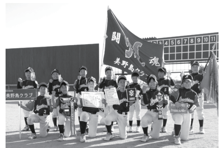
第18回大会 (2023. 12. 10) 優勝 美野島クラブ (博多区) 準優勝 那珂イーグルス (博多区) 3 位 七隈ジュニアソフト (城南区) 3 位 那珂南クラブ (博多区)