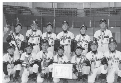
第3回大会 (2008. 12. 20) 優 勝 吉塚クリッパーズ (東 区) 準優勝 八田リトルベガサス (東 区) 3 位 清道クラブジュニア (博多区) 3 位 鶴田少年ソフトクラブ (南 区)