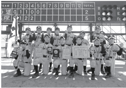
第10回大会 (2015. 12. 08) 優勝 吉塚クリッパーズ (博多区) 準優勝 百道ストロングス (早良区) 3 位 清道クラブジュニア (博多区) 3 位 千早西クラブ (東 区)