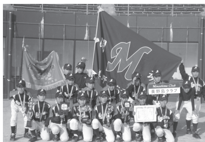
第2回大会 (2007. 12. 09) 優 勝 美野島クラブ (博多区) 準優勝 清道クラブジュニア (博多区) 3 位 南片江レオーズ (南区) 3 位 吉塚クリッパーズ (博多区)