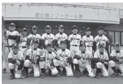
第4回大会 (2009. 12. 13) 優 勝 吉塚クリッパーズ (博多区) 準優勝 八田リトルベガサス (東 区) 3 位 清道クラブジュニア (博多区) 3 位 老司アーチンズ (南 区)