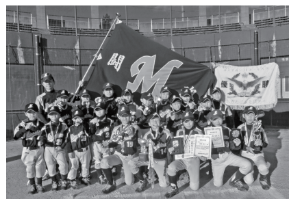
第9回大会 (2014. 12. 14) 優 勝 美野島クラブ (博多区) 準優勝 清道クラブジュニア (博多区) 3 位 赤坂ニューファイターズ (中央区) 3 位 愛好クラブ (東 区)