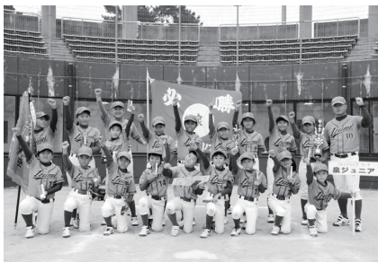
第16回大会 (2021. 12. 12) 優勝 泉ジュニア (西 区) 準優勝 南片江レオーズ (城南区) 3 位 千早西クラブ (東 区) 3 位 清道クラブジュニア (博多区)