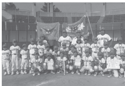
第8回大会 (2013. 12. 08) 優 勝 清道クラブジュニア (博多区) 準優勝 原田ビッグボーイズ (東 区) 3 位 香椎東ハリケーンズ (東 区) 3 位 百道ストロングス (早良区)