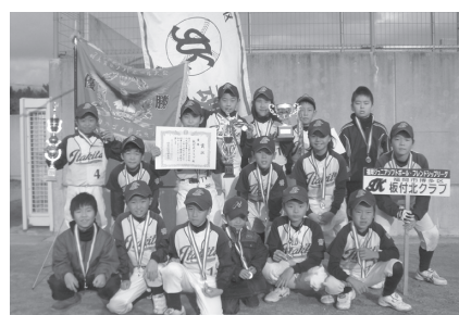
第6回大会 (2011. 12. 11) 優 勝 板付北クラブ (博多区) 準優勝 千早西クラブ (東 区) 3 位 老司アーチンズ (南 区) 3 位 次郎丸クラブ (早良区)