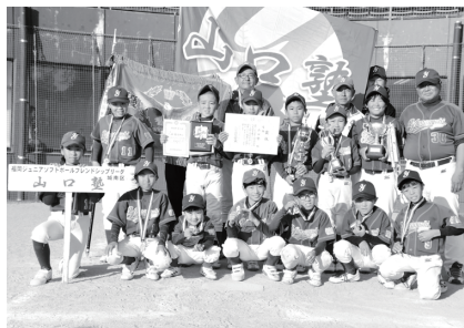
第14回大会 (2019. 12. 15) 優勝 山口塾 (西 区) 準優勝 香椎東ハリケーンズ (東 区) 3 位 愛好クラブ (東 区) 3 位 百道ストロングス (早良区)